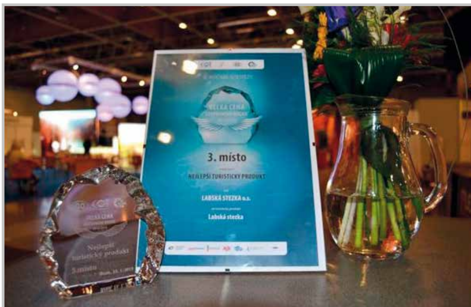
Cena ze produkt cestovního ruchu v ČR, kterou získala Labská stezka, o. s., v lednu 2015.

Labská cyklotrasa je páteří českou cyklotrasou mezinárodního významu a postupně se i díky plynulému napojení na německou část (Elberadweg) stává významným produktem cestovního ruchu. Projekt „Labská cyklotrasa od pramene k moři bez bariér“ nemá dle dostupných